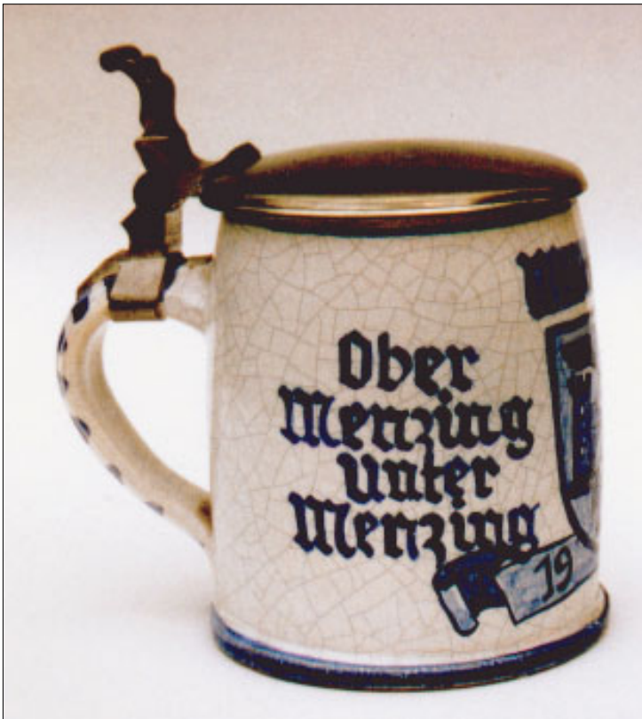
Ober Menzing Unter Menzing