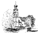
St. Georg Obermenzing