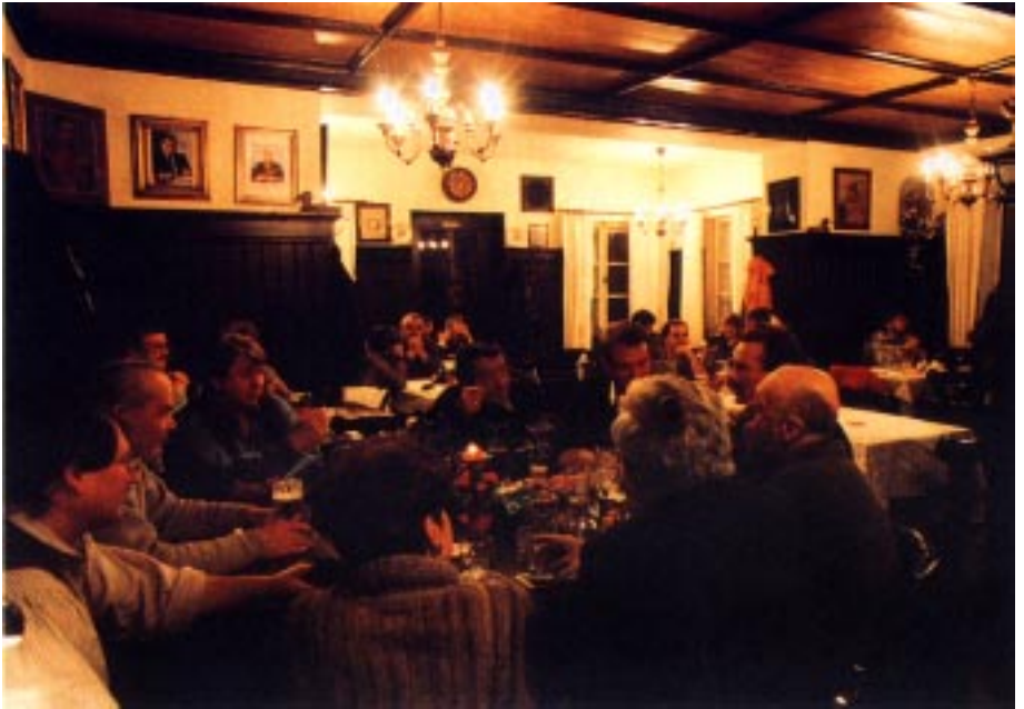
Die Stubn im Alten Wirt