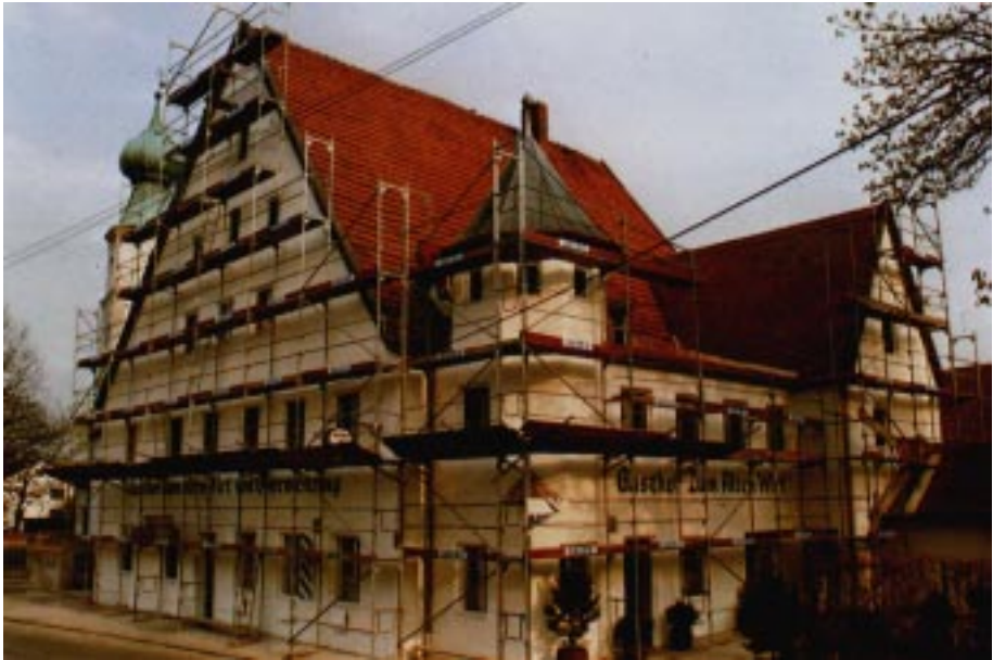
Während und nach der Außenrenovierung 1986