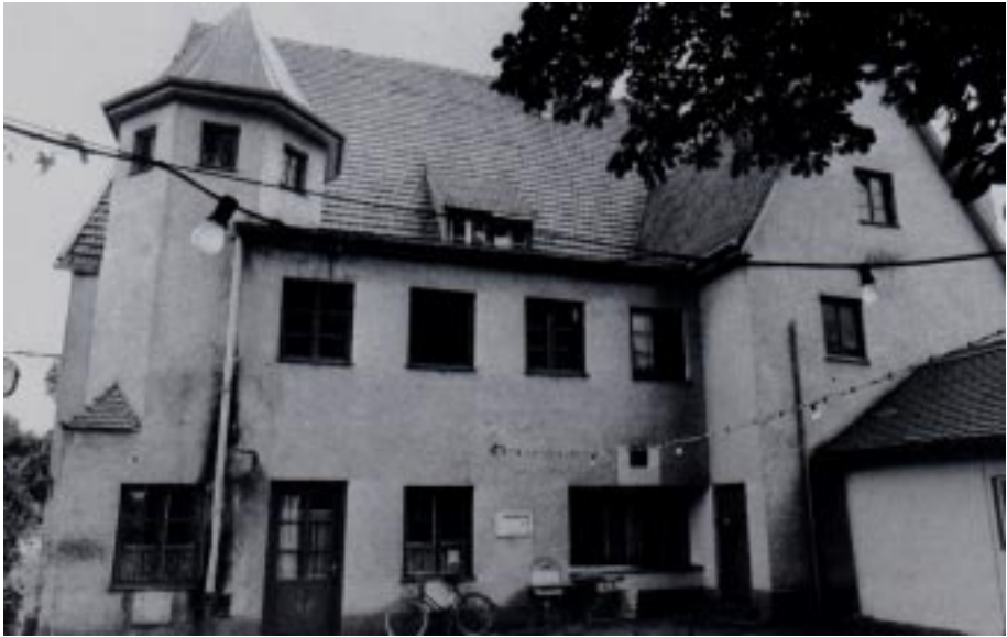
Biergarten- (West-) Seite vor und nach der Renovierung 1986