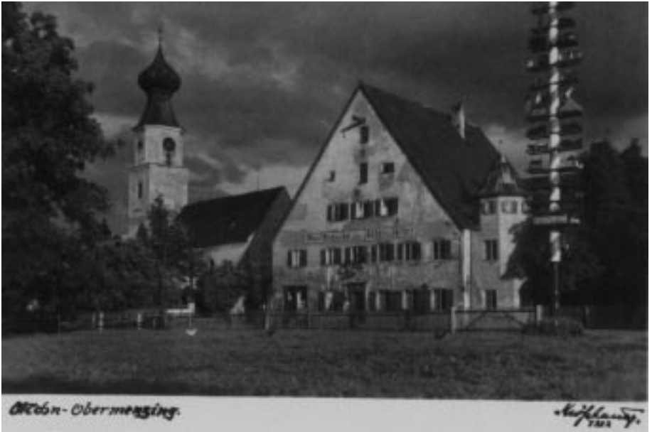
Vor der Renovierung, noch mit Aufgang zur ehemaligen Metzgerei