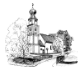
St. Georg Obermenzing