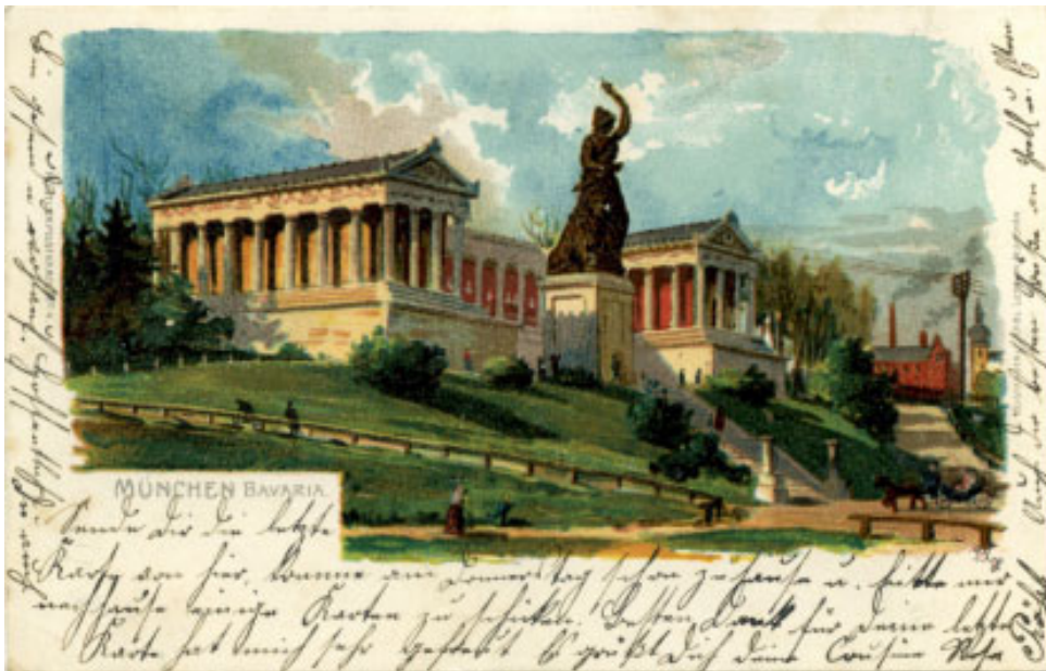
Postkarte 14,0 x 9,0 cm Signiert: Ply Gelaufen: .... 1900 Bedruckt mit: MÜNCHEN BAVARIA KÜN(S)TLERPOSTKARTE N° 4 KU(N)STANSTALT CARL LEYKUM, MÜNCHEN